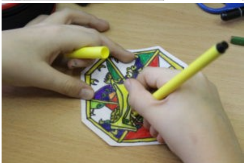
Soutěž Pečeť Karla IV.