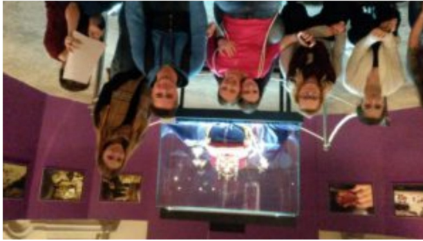
Olomouc – korunovační klenoty