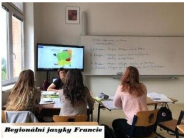
Regionální jazyky Francie