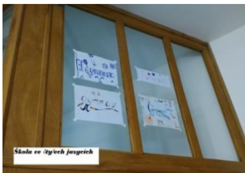
Skola ve čtyřech jazycích